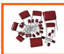
阻燃型封装料 Flame retardant EMC