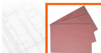
环氧绝缘板 Epoxy Insulation Board