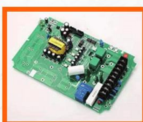
阻燃型覆铜板 Flame retardant CCl